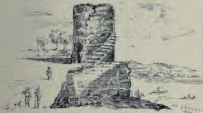
Tour Saint-Michel à Marracq (Bearn).

de Neubourg, l'héroïne — de Ruy Blas . Augereau y a campé, lors de la campagne de 1802. Tout au bas, la Nive, dont les bords sont ravissants, serpente bleue dans la verdure où les fermes mettent des taches blanches. Le domaine